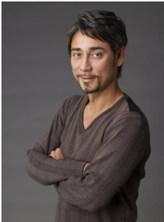
クリス・ペプラー