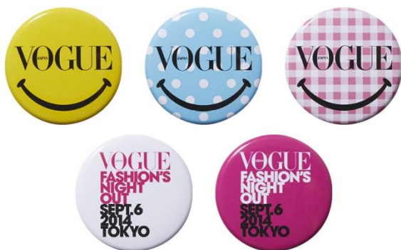
FNO オリジナルバッジ

本年も FNO のもう一つの目的「ファッションによる社会貢献」を推進するため、チャリティ企画を実施します。東京、大阪両会場の参加店舗や商業施設で募金をすると、FNO オリジナルバッジをプレゼント。募金は、東日本大震災の復興支援活動を行う認定 NPO 法人 国境なき子どもたち(KnK)に寄付いたします。詳細は FNO オフィシャルウェブサイトにて随時情報更新されます(www.vogue.co.jp/fno/)。