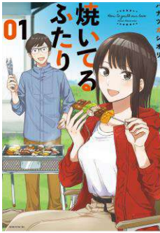
『焼いてるふたり』 ©ハナツカシオリ/講談社