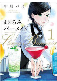
「まどろみバーメイド」 ©早川パオ/芳文社