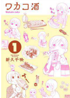
「ワカコ酒」©新久千映/コアコミックス