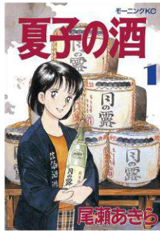
『夏子の酒』 ©尾瀬あきら/講談社