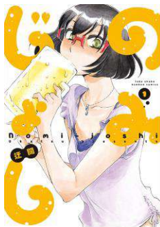
「のみじよし」 ©迂闊/竹書房