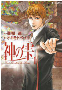
『神の雫』©亜樹直、オキモト・シュウ/講談社