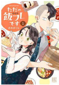
「ただの飯フレです」 ©さのさくら/幻冬舎コミックス