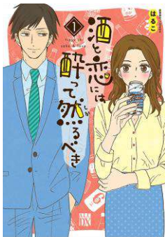
「酒と恋には酔って然るべき【電子単行本】」©はるこ (秋田書店)