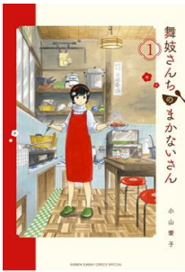
「舞妓さんちのまかないさん」 ©小山薫子 / 小学館