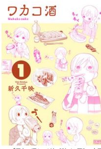
「ワカコ酒」 ©新久千映 / コアミックス