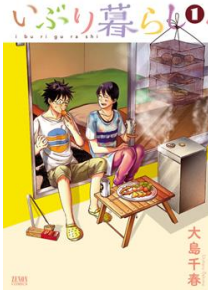
「いぶり暮らし」 ©大島千春/コアミックス