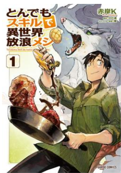
『とんでもスキルで異世界放浪メシ』©赤岸K ©江口達/オーバーラップ