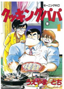
『クッキングパパ』 ©うらさわとち/講談社