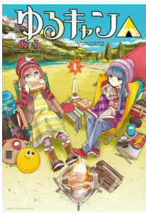
「ゆるキャン△」 ©あふる / 芳文社