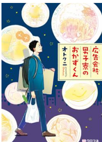
「広告会社、男子寮のおかずくん」 ©オトクニ/libre