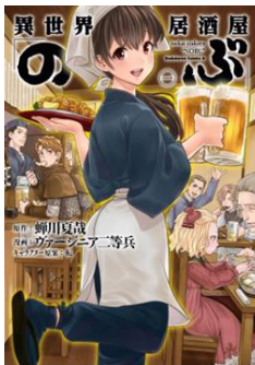
『異世界居酒屋「のぶ」』©御厨 夏哉・乾/主婦社 ©ヴァージニア二等兵/KADOKAWA