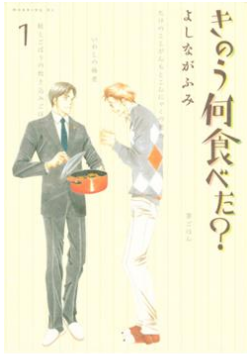
『きのう何食べた?』©よしながふみ/講談社