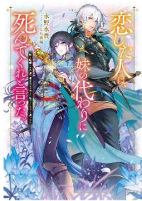
恋した人は、妹の代わりに死んでくれたと言った。