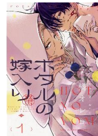
ホテルの嫁入り 【単話】