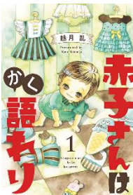
赤子さんはかく語り 【分冊版】