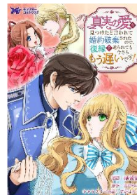
真実の愛を見つけたと言われて婚約破棄されたので、復縁を迫られても今さらもう遅いです！ (コミック) 分冊版