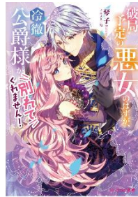
破局予定の悪女のはずが、冷徹公爵様が別れてくれません!