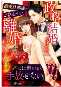
政略結婚のはずが、溺愛旦那様がご執心すぎて離婚を許してくれません