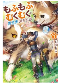
もふもふとむくむくと 異世界漂流生活