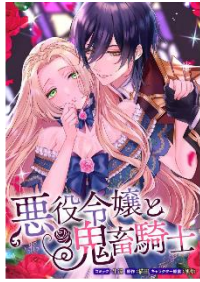
悪役令嬢と鬼畜騎士 連載版