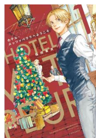
ホテル・ メツアペウラへ ようこそ