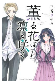
薫る花は凛と咲く