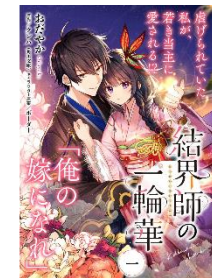
【単話】 結界師の一輪華