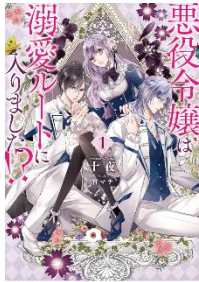
悪役令嬢は溺愛ルートに入りました!?