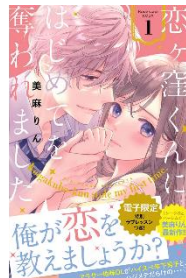
恋ヶ窪くんにはじめてを 奪われました