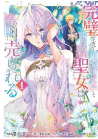
完璧すぎて可愛げのない婚約破棄された聖女は隣国に売られる