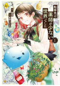
転移先は薬師が少ない世界でした