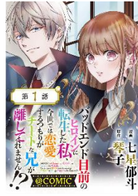
【単話版】 バッドエンド目前のヒロインに転生した私、今世では恋愛するつもりがチートな兄が離してくれません!? @COMIC