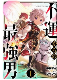
不運からの最強男