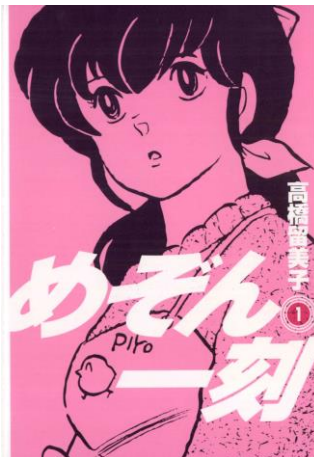
「めぞん一刻」(新装版) ©高橋留美子/小学館

あなたもひっくるめて、響子さんをもらいます。 -「めぞん一刻」(小学館)より- : 893 票