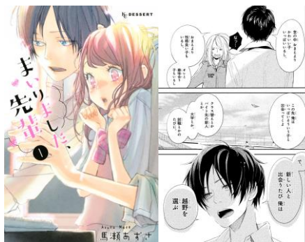
『まいりました、先輩』©馬瀬あずさ/講談社

「この先どんな出会いがあっても、ずっと一緒にいられると信じられる言葉だから」 「ずっと君だけ、という想いが伝わるから」 「ずっとあなただけですって言われるよりも、飾らず素直な気持ちに感じて信じられるから」