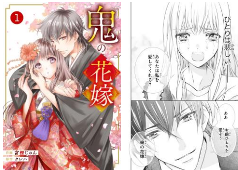
「noicomi 鬼の花嫁」©高榎じゅん・クレハ/スターツ出版

「その人一人だけを生涯愛し続ける事は素敵だなと思ったから」 「ストレートにただ一人と言った方が気持ちが伝わるかなと思ったので」 「ずっとそばにいる覚悟がみえる言葉なので選びました」