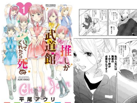
「推しが武道館いってくれたら死ぬ」©平尾アウリ/徳間書店

「自分もドルヲタなので、わかりみが深い…」 「貴方じゃなければダメなんだという必死な感じが伝わってくる」 「自分が心に決めたただ一人の人を想ってる気持ちが伝わる言葉だと思ったので」