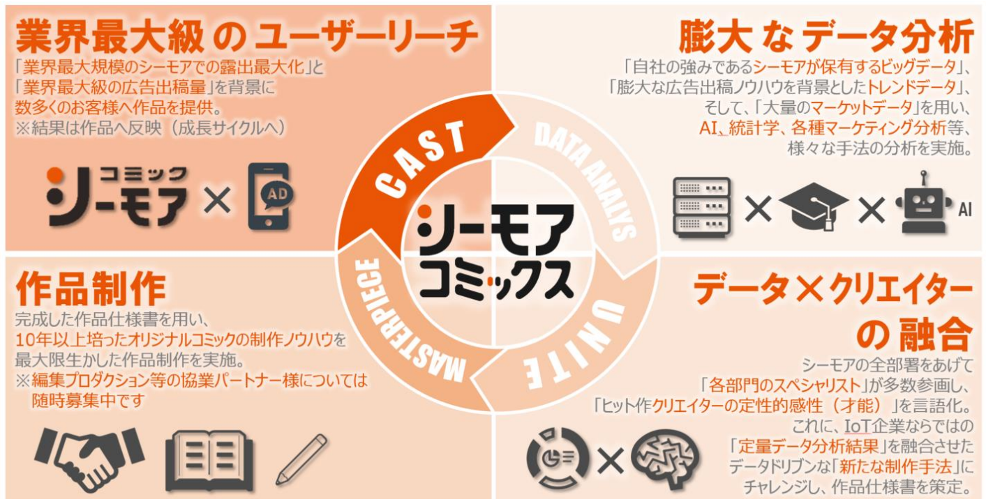
（図1）『シーモアコミックス』ビジネスモデル イメージ

個性豊かなオリジナル作品を幅広いジャンルで創出し続ける『ソルマーレ編集部』と異なり、『シーモアコミックス』は、データを活用した新たな制作手法にチャレンジします。