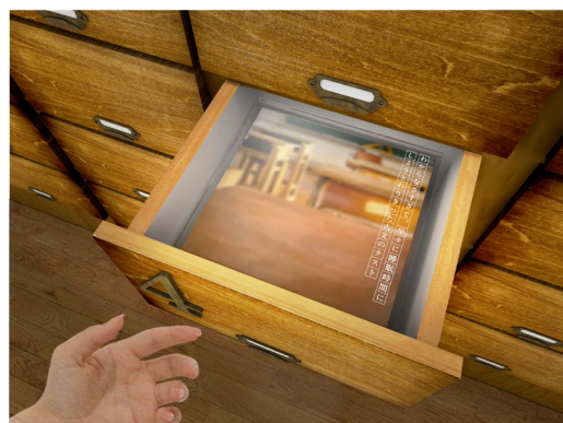
「香屋-KAORIYA-」展示イメージ