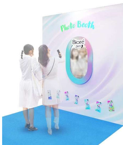
※フォトブースイメージ

「ビオレZero」をフォロー & タグ付けして、「ビオレZero」コーナーのフォトブースで撮影した写真や体験の様子をSNSに投稿していただいた方限定で、『ビオレZero シート サンプル（3枚入）』をプレゼントいたします。