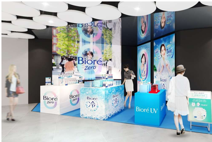
※画像はイメージとなり、実際の展開とは異なる場合がございます

コスメ・美容の総合サイト「アットコスメ」を運営するアイスタイルは、2024年上半期の美容トレンド「@cosmeベストコスメアワード2024上半期トレンド予測」において、ヘルスケア・化粧品業界が注目する美容トレンドとして「#夏慢性化攻略」というキーワードを発表しました。2024年は、従来「夏限定」のイメージが強かった「ひんやりアイテム」や夏定番の悩みである「テカリ」や「湿気」対策、夏に気になる「臭い・汗ケア」アイテムに、夏を迎える前から生活者の関心が高まると予測されています。