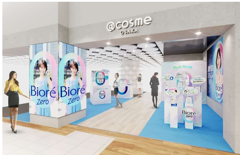
※画像はイメージとなり、実際の展開とは異なる場合がございます