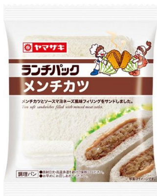
「ランチパック」メンチカツ