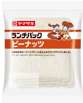
「ランチパック」ピーナッツ