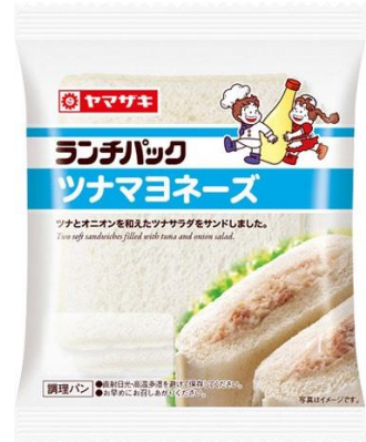
「ランチパック」ツナマヨネーズ