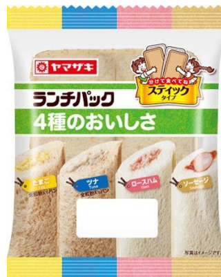
「ランチパック」4種のおいしさ