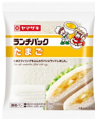
「ランチパック」たまご