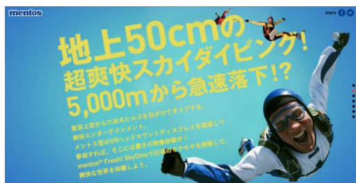
※サイト画面イメージ