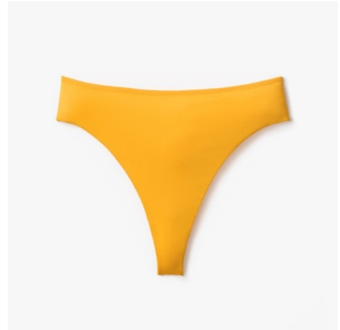
Curving Line Shorts

本ブランドの人気商品であるブラとショーツ「Curving Line Bra」「Curving Line Shorts」より、国際女性デーのシンボルフラワーであるミモザをイメージした新色「Mimosa」が数量限定で登場します。