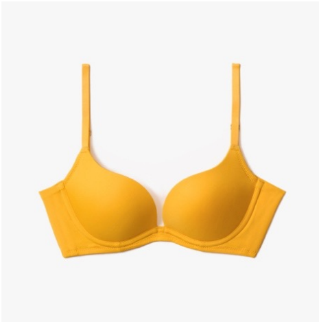
Curving Line Bra