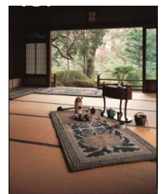
鍋島緞通 新鍋島 蟹牡丹唐草緑二重雷文 淡々墨茶地