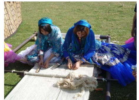
イラン カシュガイ族の織り子による ギャッベ手織り実演会&体験会 民族衣装をまとった記念撮影もお楽しみいただけます。

詳しくは http://www.idc-otsuka.jp/fair/carpet/ でご覧いただけます