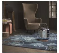
WEDGWOOD — HOME —