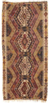
マラティア産 アンティーク キリム