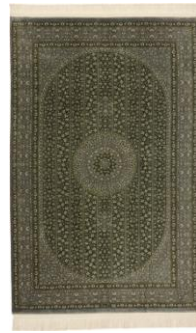
ペルシャ絨毯 クム産 マスミ工房

特別出品される美術品級の希少な絨毯としては、ペルシャ絨毯のなかでも最も有名なアルダビル絨毯（ヴィクトリア・アンド・アルバート美術館およびロサンゼルス郡立美術館所蔵）の複製品をはじめ、トルコを代表する美術工芸品として王室や各国首脳にも献上されるトルコ絨毯「ヘレケ」の名品、南ペルシャの遊牧民が織り上げる「ギャッベ」の名門ブランド、ゾランヴァリ社が手掛けるシルクを使った新作「クندانシルク」の逸品、伝統的な文様を織り込まれたデザインで人々を魅了しつづける「キリム」は、市場で人気を得ている50年以上前におられた「オールドキリム」や、100年以上前に織られた芸術品としても評価を得る「アンティークキリム」など、多彩な産地より厳選された品々を期間限定で取り揃えます。