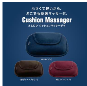
クッションマッサージャ HM-342