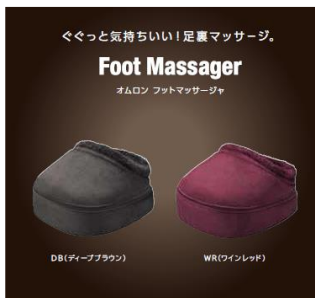
フットマッサージャ HM-241