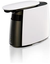
パーソナル保湿機 HSH-100