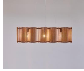
「Legno SZP0013」 ※写真はすべてウォールナット