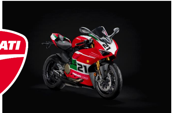
レースへの情熱を体現した記念モデル「Panigale V2 Bayliss」

イタリアを代表するラグジュアリーファニチャーブランド「Poltrona Frau（ポルトローナ・フラウ）」は、8月27日（土）から9月4日（日）まで『Ducati meets Poltrona Frau』を開催いたします。