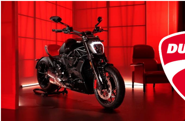
限定モデル「Ducati XDiavel Nera」