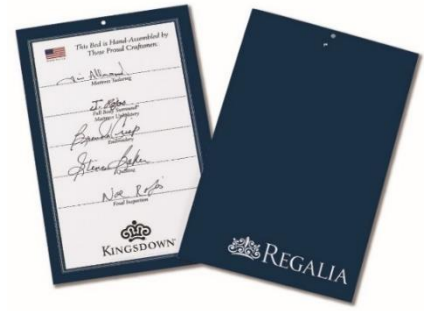
「ザ・グランレガリア」に添えられるシグネチャーカード

その証として製品には、各工程を担当した職人とすべての工程を管理する総責任者が厳しく検査し、署名したシグネチャーカードが添えられています。