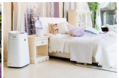
写真は新宿ショールーム