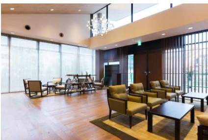
ゲストサービスセンター

7月2日（水）にスケールアップオープンした「軽井沢・プリンスショッピングプラザ」内フードコート、軽井沢の玄関口である軽井沢駅南口に新設される「軽井沢 プリンスホテルゲストサービスセンター スマイルコンシェルジュ」、そして、ハイクオリティを極めた「軽井沢72ゴルフ 東コース新クラブハウス」といった新施設のインテリアも、IDC大塚家具がプロデュースしています。