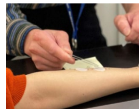
図 3. 温泉水を含ませたろ紙を腕に置く様子

皮脂成分の一つであるオレイン酸を付着させたろ紙を 41℃の温泉水または精製水に 16~18 時間浸し、その後ろ紙に残った油分を染色・観察しました。不要な皮脂は肌トラブルの原因となるため、適切に取り除く必要があります。