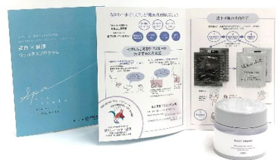
なにわ一水 美肌ウェルネス体験プログラムのキット (イメージ)

https://ir.po-holdings.co.jp/news/news/news-7141676728482548474/main/0/link/20230727_wellness_s.pdf