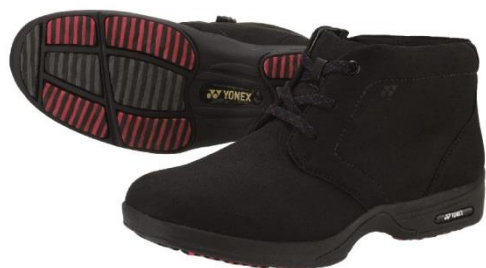
(女性用 L78HS) ブラック