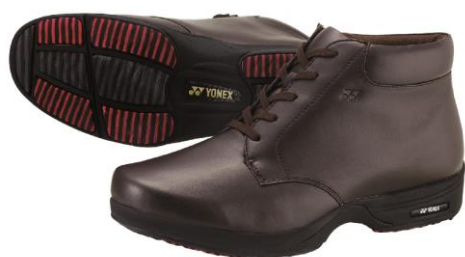
(男性用 M78HS) ダークブラウン