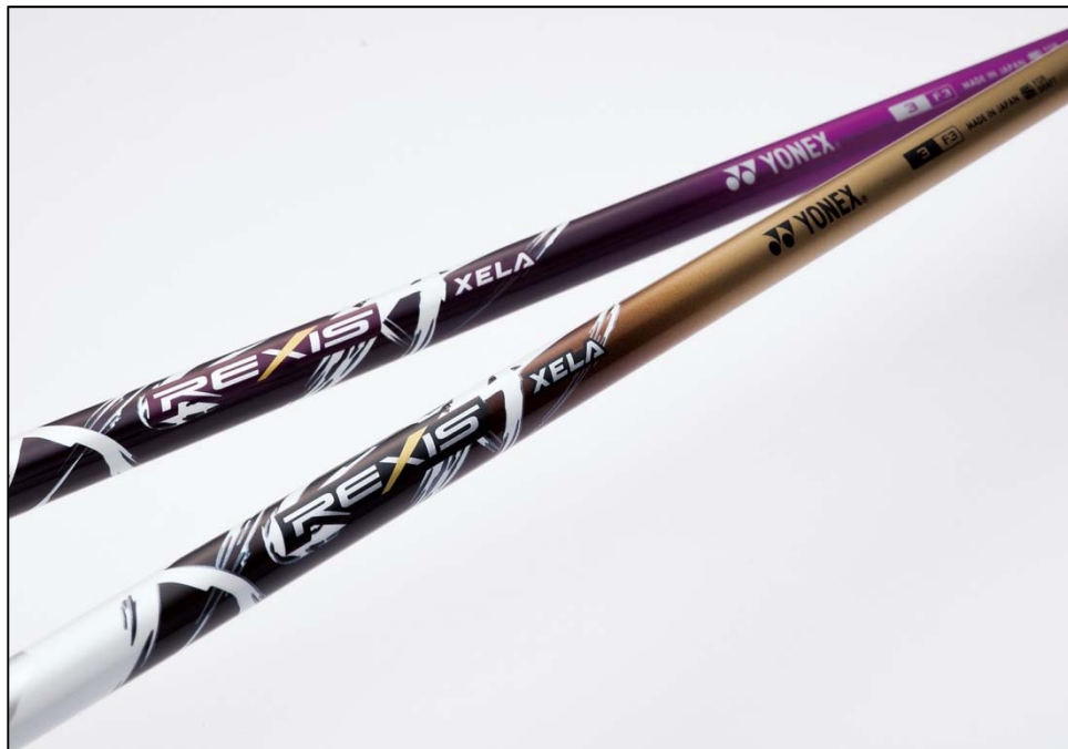
▲世界最軽量 31gのシャフト「REXIS XELA(レクシス キセラ)」 パープル（上）とゴールド（下）

ヨネックス株式会社（代表取締役社長：米山勉）は、カスタムフィッティングオーダーでご好評をいただいておりますヨネックス製ナノメトリック複合グラファイトシャフト「REXIS XELA(レクシス キセラ)」にこの度、世界最軽量※1 31gの新スペックを2014年9月下旬に発売いたします。