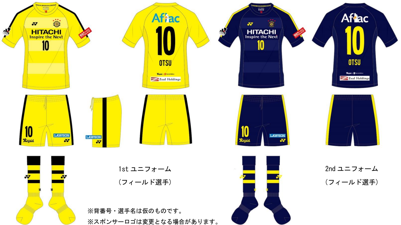
1st ユニフォーム (フィールド選手)