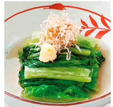
有機ロメインレタスのお浸し