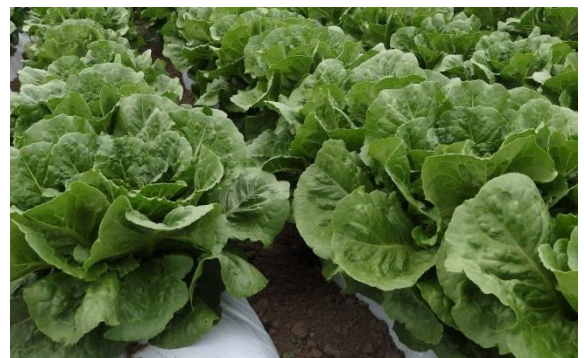
オーガニックのロメインレタスはワタミファーム2農場で栽培

今後も、2002年からワタミファームで培ってきた有機農業の知識や技術をいかすとともに、気象や地理的な条件に合わせて長野県東御市の東御農場、群馬県高崎市の倉淵農場といった2カ所の農場で栽培していきます。