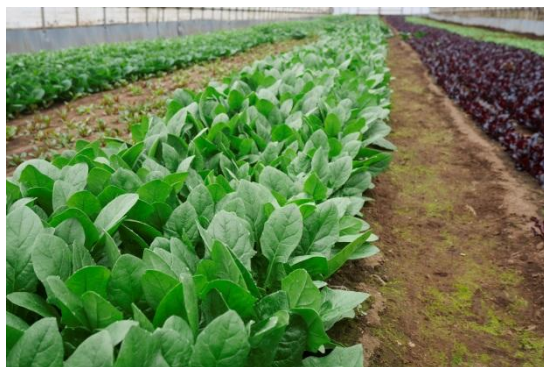
千葉県香取市の佐原農場で栽培している オーガニックベビーリーフ