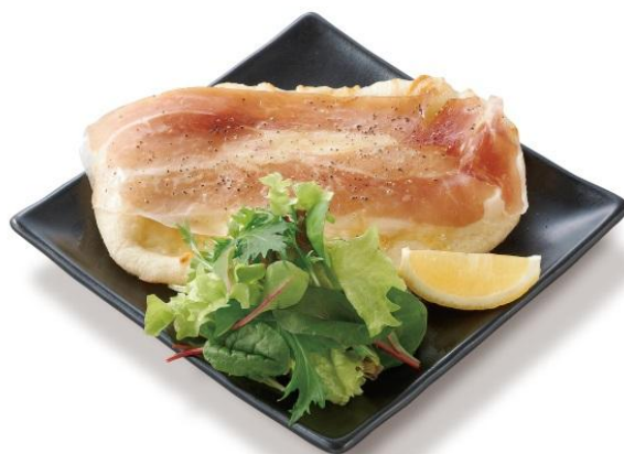
100%オーガニック野菜新メニュー第1弾 「有機ベビーリーフと生ハムのサラダピザ」