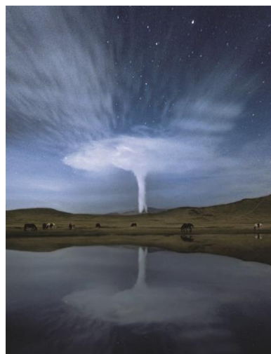
第37回プリント部門 最優秀賞 『朝の草千里』 大野 義人