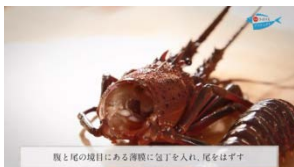
甲殻類や貝類の下処理も網羅 伊勢えび