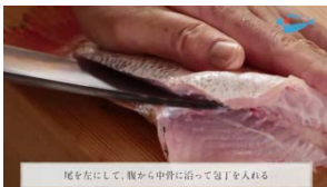
分かりやすいカメラアングル 喉黒（のどぐろ）