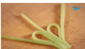
美しいつまの作り方も 扇胡瓜（おうぎきゅうり）