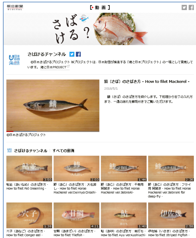
100種以上の動画が並ぶ様子は圧巻（チャンネルトップ;PC版）