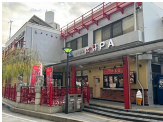
阪神高速道路3号神戸線・京橋 PA

看板メニューのラーメンは、こだわりの特製醤油タレに鶏と豚を贅沢に使ったスープ、国産豚背脂を効かせ、深みがあり幅広い世代に喜んで頂ける味に仕上げています。中でも「人類みな京橋ラーメン」(900円)は、自慢の豚バラチャーシュー3枚に、食感が嬉しい極細メンマ、太ネギをのせた1品。その他、7枚の