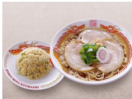
半チャーハンセット(1280円)

看板メニューのラーメンは、こだわりの特製醤油タレに鶏と豚を贅沢に使ったスープ、国産豚背脂を効かせ、深みがあり幅広い世代に喜んで頂ける味に仕上げています。中でも「人類みな京橋ラーメン」(900円)は、自慢の豚バラチャーシュー3枚に、食感が嬉しい極細メンマ、太ネギをのせた1品。その他、7枚の