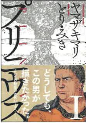
『プリニウス』(新潮社)