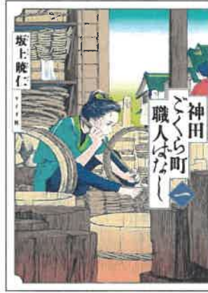
『神田ごくらく町職人ばなし』(リイド社)