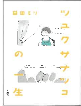
『ツユクサナツコの一生』(新潮社)