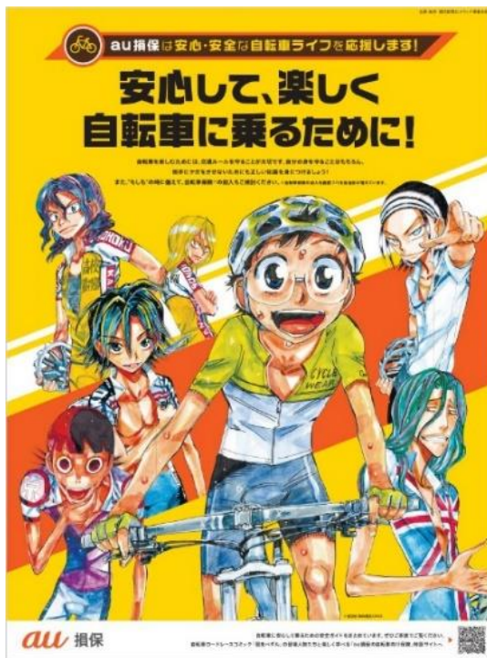
【新聞広告ビジュアルイメージ】 ©渡辺航 2008(秋田書店)

※1…2023年4月1日より、全ての自転車利用者に対し、ヘルメット着用の努力義務が課されました。