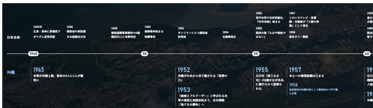
日本と沖縄で起きた主要な出来事を整理した年表

写真は「朝日新聞フォトアーカイブ」( https://photoarchives.asahi.com/ )から購入できます。特設サイトの関連リンクからアクセスできます。