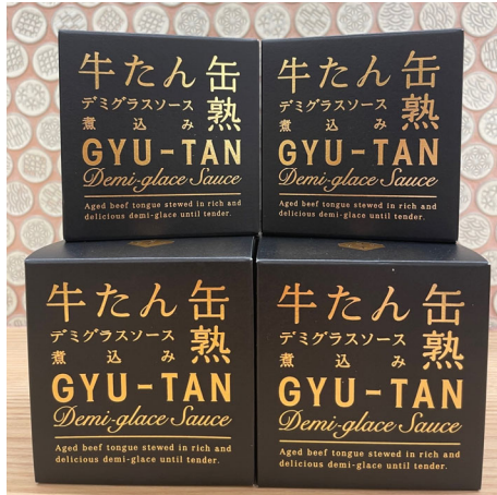
木の屋石巻水産の「牛たんデミグラスソース煮込み」

株式会社朝日新聞社（代表取締役社長：中村史郎）のグループ企業である株式会社朝日エアポートサービス（代表取締役社長：高津利明）は、日本の優れたものを集めたセレクトショップ「いっぴんさん。」の4号店を10月26日、JR大阪駅桜橋口すぐの「エキマルシェ大阪」にオープンします。「気軽に使える。ずっと使える。毎日を豊かに。」がコンセプトの「いっぴんさん。」は、関西国際空港、大阪（伊丹）空港の両店が昨年、阪急三番街店（梅田）が今年2月にオープンし、今回が4軒目の出店です。エキマルシェ大阪店はその中でも店舗面積が最も小さく、「いっぴんさん。」では初となる飲料と食品のみのセレクトショップです。