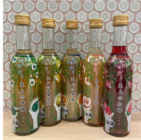
北岡本店の「天上のリキュール」

エキマルシェ大阪店のテーマは「お酒は 100 種類。商品すべてが国産品」。自分へのご褒美やちょっとしたギフトを探しに、会社帰りに毎日立ち寄りたくなるお店を目指しています。店内に入るとまず目に留まるのは、お店の三分の一を占めるカラフルなお酒たち。「ジャケ買い」したくなるようなお酒が所狭しと並んでいます。創業 140 余年の「八木酒造」（奈良県奈良市）が奈良県産の青梅で手作りした「ならまち うめ酒」は、完熟した梅のトロとした飲み心地が楽しめます。