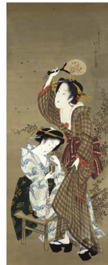
抱亭五清《蜜符二美人図》 板橋区立美術館蔵 前期展示