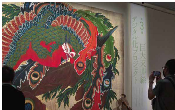
葛飾北斎《岩松院本堂天井絵「鳳凰図」(通称：八方睨み鳳凰図)》原寸大高精細複製原図 NTT ArtTechnology/アルステクネ蔵