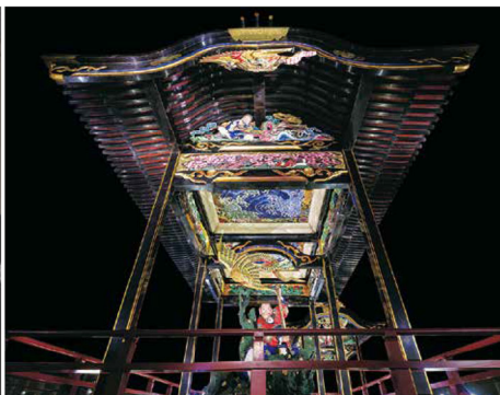
《小布施町上町祭屋台》(長野県立)小布施町上町自治会蔵