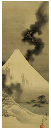
葛飾北斎《富士越龍》北斎館蔵 後期展示