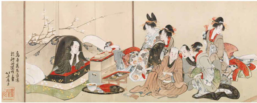
葛飾北斎《隅田川兩岸景色回巻》(部分)すみだ北斎美術館蔵 通期展示 ※展示箇所は前・後期で変わります。