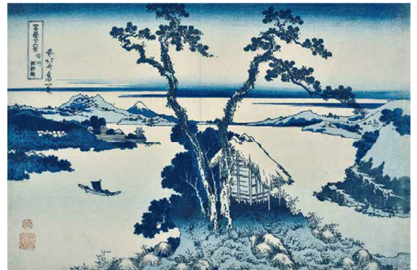
葛飾北斎《富嶽三十六景 信州諏訪湖》日本浮世絵博物館蔵 前期展示