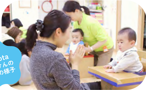
Kubota のうけんの 教室の様子