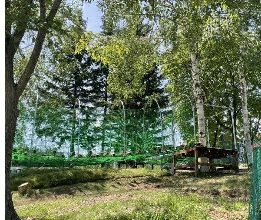
ネットツリートレッキング (イメージ)