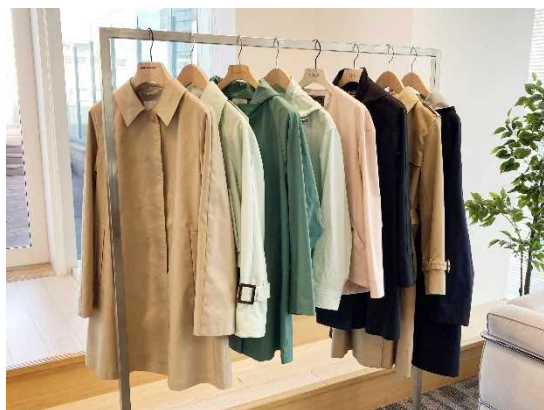
2025年春「花粉プロテクトコート」

2025年の「花粉プロテクトコート」は、全5ブランド10型（ウイメンズ：9型、メンズ：1型）を展開。 花粉が付着しにくい機能に加え、全型には防水機能を備えています。 いずれも花粉飛散が本格的となる2月から6月の梅雨シーズンまで長く着用でき、着用するシーンに合わせてファッションとして楽しめるデザインのスプリングコートを提案いたします。