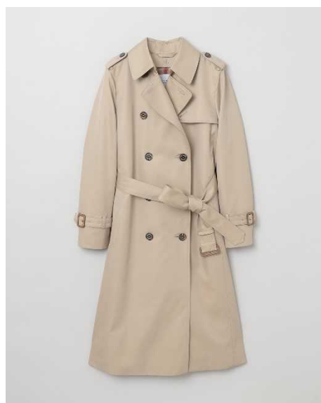
「マッキントッシュ フィロソフィー」 RYDALトレンチコート（105 cm丈）

花粉プロテクト機能とはっ水機能を持つ素材です。フードを取り外すとシンプルなスタンドカラーコートになるデザインです。ウエスト部分は内側から調節可能で、シルエットの変化を楽しむことができます。