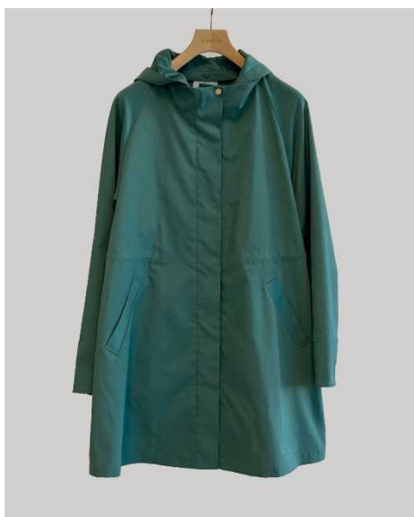
「アマカ」フード付きスタンドカラーコート

東レの花粉対策素材「アンチポラン®」を使用。花粉プロテクト機能とはっ水性を持っています。アームホールには抗菌、消臭テープを備えており、コート内の蒸れや汗などの気になるにおいを抑えます。フードは取り外し可能です。