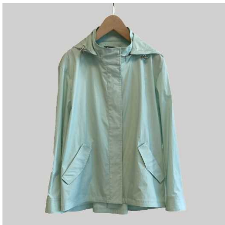
「トランスワーク」フード付きショートブルゾン