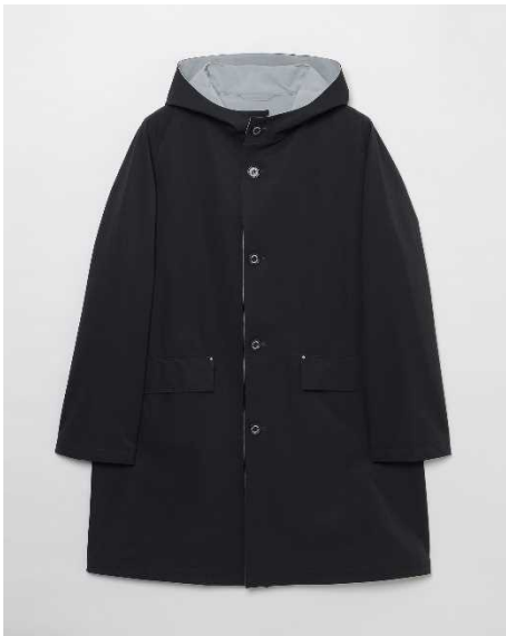
「マッキントッシュ フィロソフィー」 HUNTLEY HOOD フーデッドコート

ブランド：「MACKINTOSH PHILOSOPHY（マッキントッシュ フィロソフィー）」