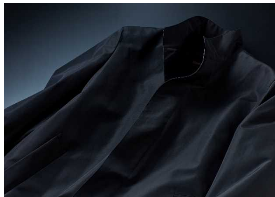
“真の黒”を追求した「BLACK OF BLACKs」

糸の選定、染色、加工の3段階で工夫を重ね、通常の黒よりもさらに深みのある色合いの“真の黒”を実現しました。