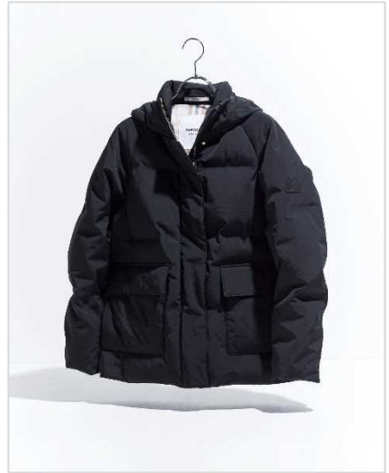
サンヨーコート (ウィメンズ) 18万7000円