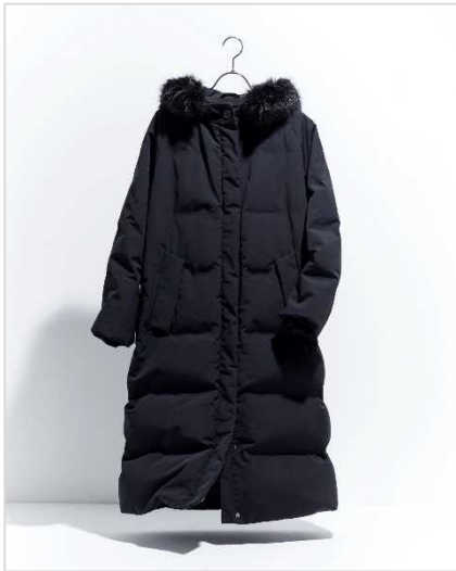
マッキントッシュ ロンドン (ウィメンズ) 19万8000円 (レギュラーサイズ)、 21万3400円 (Lサイズ)