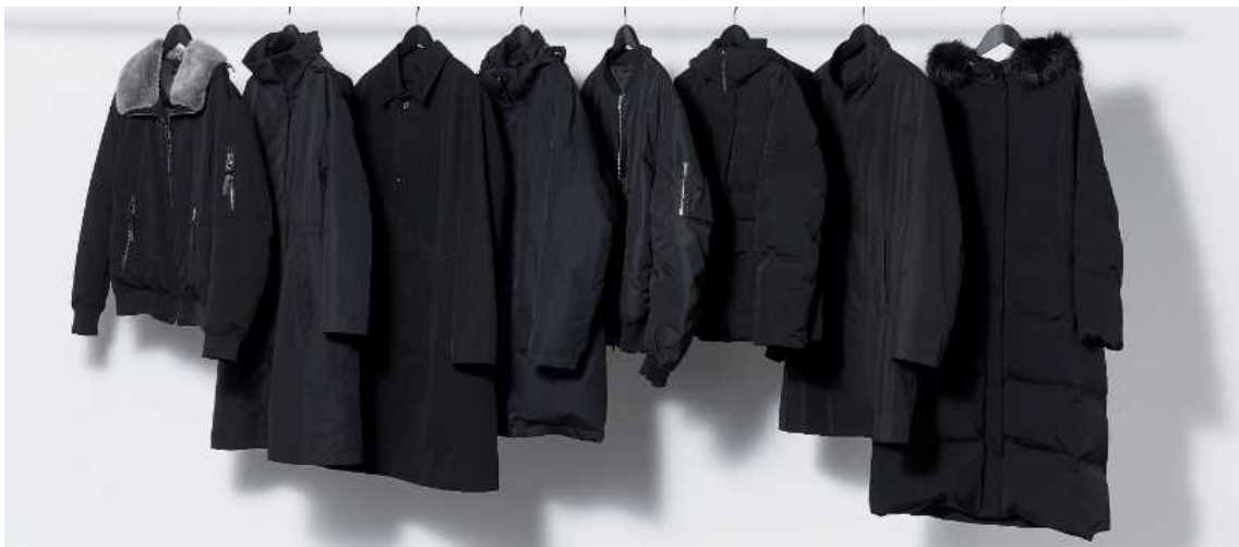
上質感のある深い黒を実現「BLACK OF BLACKs」

なお、10月31日(木)～11月12日(火)の約 2 週間、当社が運営するセレクトショップ「ラプレス青山」「ラプレスニューマン横浜」「ラプレス天神」の 3 店舗では、各ブランドの「BLACK OF BLACKs」のコート・ブルゾンをディスプレイ一堂に訴求いたします。