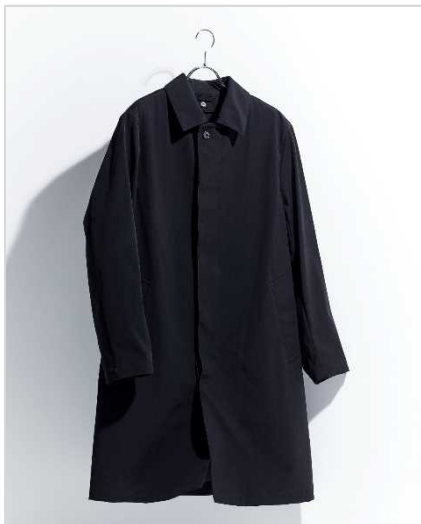
マッキントッシュ ロンドン (メンズ) 13万7500円