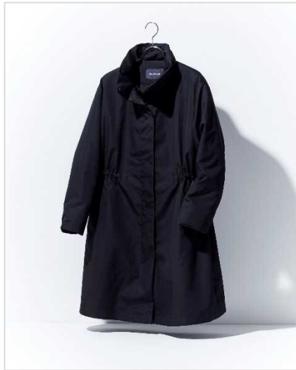
ポール・スチュアート (ウィメンズ) 17万6000円