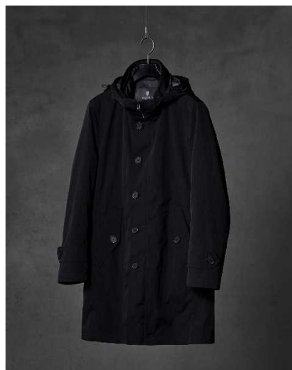
ブラックレーベル・クレストブリッジ 11万5500円