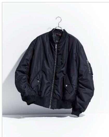
ラブレス (メンズ) 5万5000円