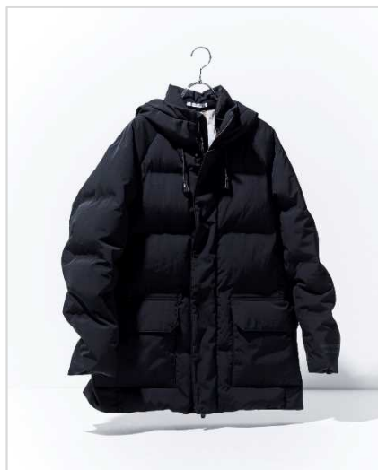
サンヨーコート (メンズ) 20万9000円