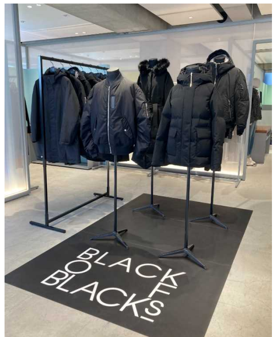
「ラプレス青山」1階のカフェ横に設置した「BLACK OF BLACKs」の商品群 (2024年10月31日撮影)

(※5)「ラプレス青山」ではブラックレーベル・ Crestブリッジを除く9ブランドの「BLACK OF BLACKs」をディスプレイ販売。ディスプレイ期間以降も販売は継続します