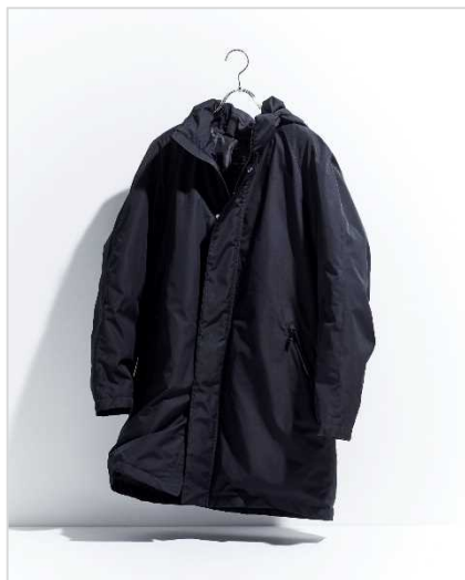
ザ・スコッチハウス 9万7900円