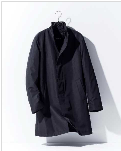
ポール・スチュアート (メンズ) 12万1000円