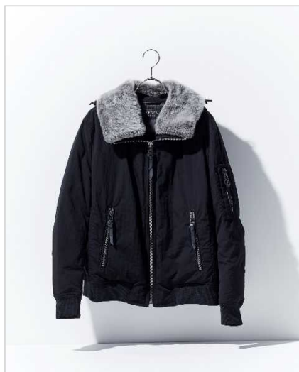
エポカ ウォモ 13万2000円