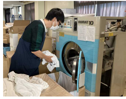
クリーニングの様子