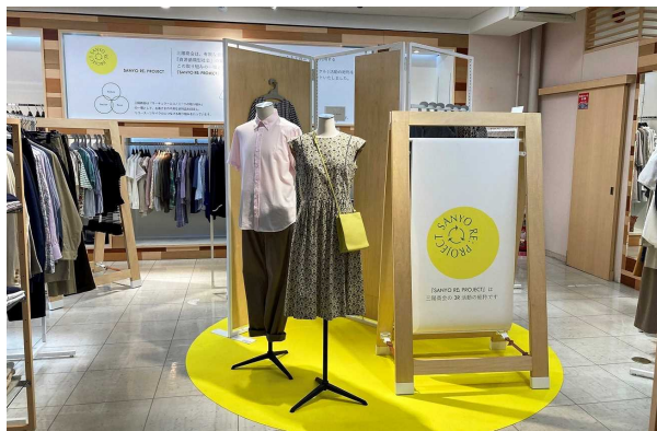
販売を開始した「三陽商会認定リユース品」 販売1号店「サンヨーG&B アウトレット落合店」の店内