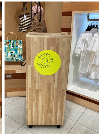
衣料回収ボックス