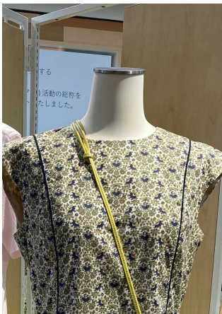
卵殻を用いたトルソー

また、当社のリユース事業についての説明パネルの展示をはじめ、衣料回収ボックスの設置により、リユース事業や回収活動を訴求していきます。