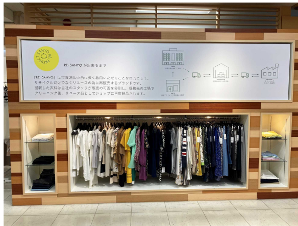
リユース事業についての説明パネルの展示