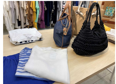
販売する「三陽商会認定リユース品」の一例 ※ 2024年6月21日時点での販売品