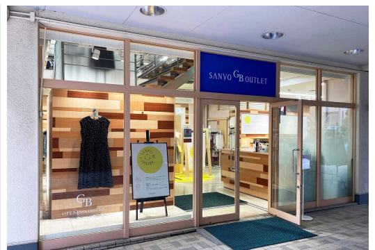
サンヨーG&B アウトレット落合店 外観