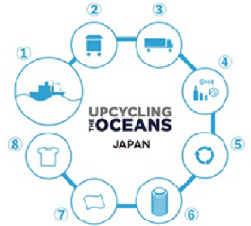
「UPCYCLING THE OCEANS」の仕組み

「ECOALF」は、創業者ハビエル・ゴジネーチェが自身の子どもが生まれたことを機に次の世代に残すべき世界について考え 2009 年にスペインで立ち上げられたサステナブルファッションブランドです。“Because there is no planet B®”（第 2 の地球はないのだから）をスローガンに、すべてのアイテムを再生素材や環境負荷の低い天然素材のみで製造し販売しています。ファッション産業が世界で 2 番目に環境を汚染している産業と言われる中で、ペットボトル、タイヤ、漁網などを独自の技術でリサイクルしてこれまで 400 種類以上もの生地を開発し新たな製品をつくり出しています。