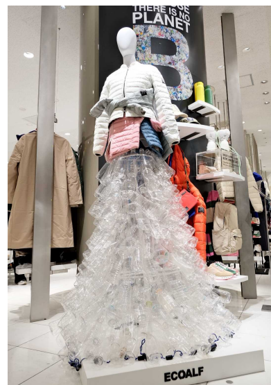
初披露の「アップサイクル・トルソー」とペットボトルタワーによるインスタレーション

伊勢丹新宿店のポップアップストアでは、冬の季節に向けウイメンズの冬物アウターをフルラインアップで展開。ミニマルなフォルムとニュートラルなカラーが特徴のタイムレスでサステナブルなプレミアムライン『Ecoalf 1.0』のコートを先行発売するとともに、「ECOALF」初となるリサイクルウール 100%の素材によるコートや、コーヒー豆のかすを生地の原料として有効活用した「ECOALF」を象徴する KATMANDU ジャケットの新モデルを揃え、最新のサステナブルアウターをご提案いたします。