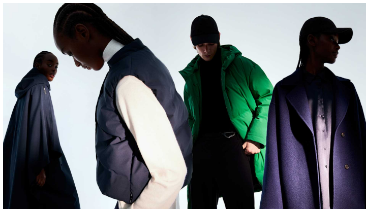
最新のサステナブルアウターを提案 伊勢丹新宿店「ECOALF」ポップアップストア