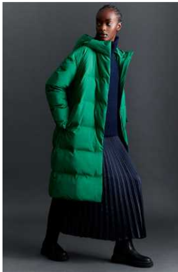
中わたコート リサイクルナイロンを使用

表地はリサイクルナイロン 100%、中わたはペットボトル由来のリサイクルポリエステルを使用したコート。シームレス仕様によるクリーンな表面が特徴。