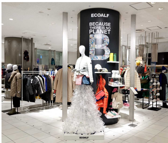
「アップサイクル・トルソー」を初披露 伊勢丹新宿店「ECOALF」ポップアップストア

商品では、コート需要が高まる時期に向けウイメンズの冬物アウターをフルラインアップで展開し、最新のサステナブルアウターをご提案いたします。そのほか色鮮やかなニットアイテム、雑貨、ユニセックスでの着用として需要のあるメンズ商品も一部取り揃え、廃棄物をリサイクルした素材等を用いたスタイリッシュなアイテムを展開いたします。