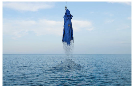
「ECOALF」イメージビジュアル

Facebook https://www.facebook.com/ecoalfjapan/