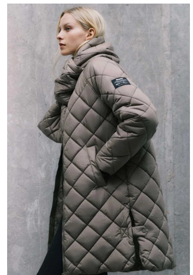
中わたコート モノマテリアルのアウター

TONE コート <プレミアムライン Ecoalf 1.0> ¥69,300 1色 (ウイメンズ)