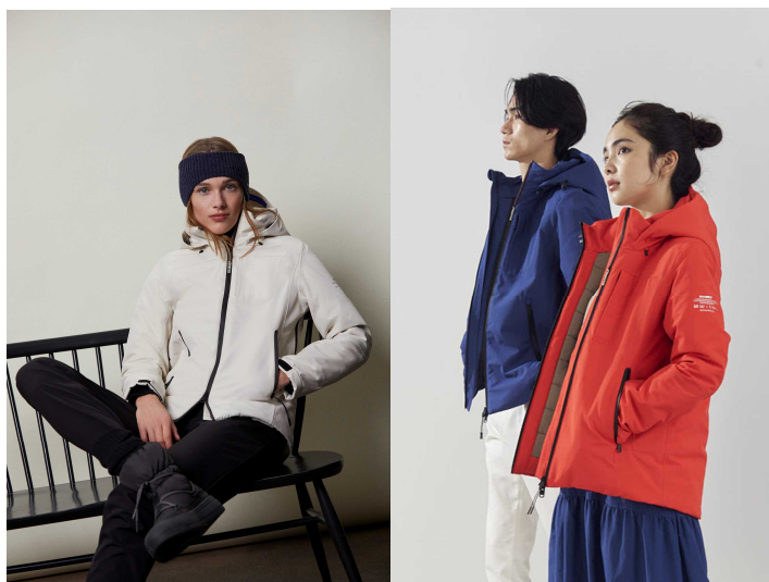
防寒ジャケット コーヒーかすを生地に活用

「ECOALF」を象徴する KATMANDU ジャケットの新モデル。コーヒー豆のかすを生地の原料として有効活用。1着に約 40 杯分のコーヒーかすを原料の 1 つとして使用しています。