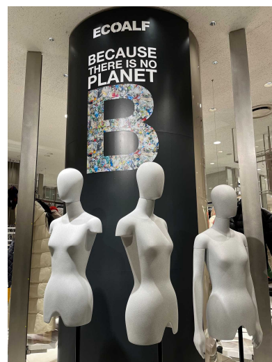
廃棄服を原料とした「アップサイクル・トルソー」