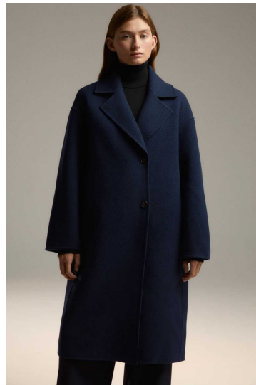
ウールコート リサイクルウールを使用

「ECOALF」初となるリサイクルウール 100%の素材によるコート。軽やかな仕立てと、リラックスシルエットが特徴。