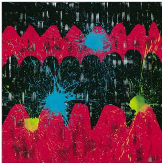
“SINGIN'IN THE RAIN”