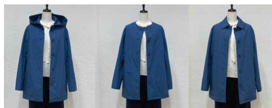
3WAYコートの襟の付け替え例

ブランド : アマカ デザイン : 3WAYコート 表素材 : ポリエステル 65%、複合繊維 (ポリエステル) 35% 色展開 : ブルー、ベージュ、ネイビー 税込価格 : ¥40,700 当社型番 : V5A03-115 ※2月中旬発売予定