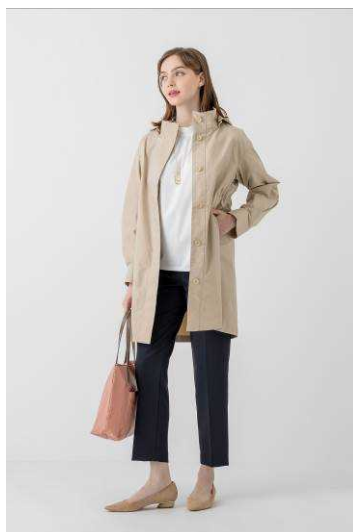
(スタンドカラーコート)