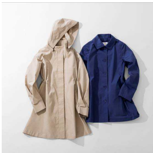
(左: スタンドカラーコート 右: 3WAYコート)