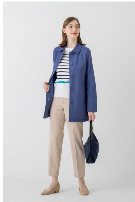
「アマカ」 衿やフードの着脱により3通りに着用できる 「花粉プロテクトコート」

コートを創業アイテムとする当社では、メンズでは2007年から、ウィメンズでは2010年から“おしゃれに花粉対策”をコンセプトにした「花粉プロテクト」機能のあるコートの販売を開始し、本格的に花粉が飛散するシーズンに向けた羽織りアイテムとして提案しています。