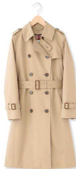
RYDALトレンチコート (96cm丈)