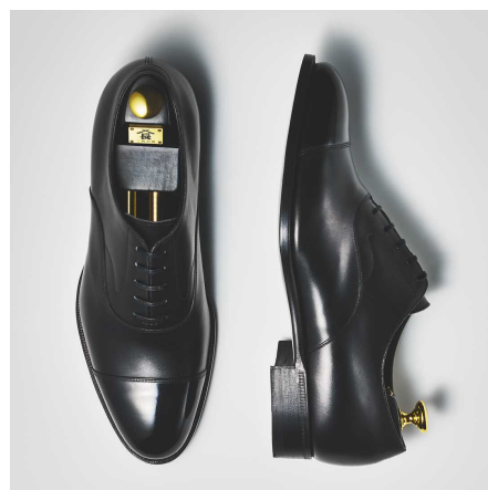
「三陽山長」の原点であり象徴 マスターピースストレートチップ『友二郎』

革靴業界では、ローファーやスリッポンといったカジュアルなモデルが好調な半面、ビジネ