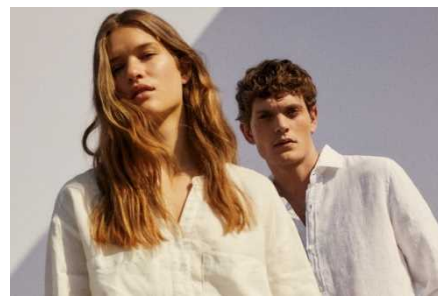
2022 年春夏「ECOALF」イメージビジュアル

ブランド開始年度： スペイン 2009年ブランド設立（スペイン ECOALF社） 日本 2020年3月より展開（三陽商会）