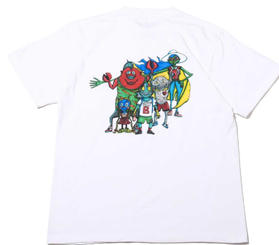
atmos、ECOALF、玄氏による3者コラボTシャツ（税込¥6,050） 後ろには玄氏が描いたアートをプリント

POP UP STORE 期間中はコラボTシャツに玄氏のアートワークをプリントするカスタマイズも可能です。