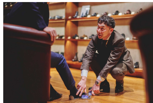
『パターンメイド』採寸の様子