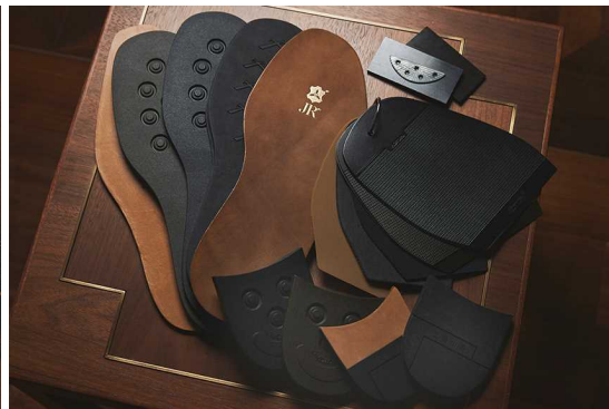
ソールの素材もバリエーション多彩

アッパーの素材には一流タンナーから厳選した上質なレザーを豊富に取り揃えています。履き心地に影響する底材やヒール材も充実しており靴底はレザー 2 種、ラバー 3 種を用意。爪先側だけに薄いゴムを貼るハーフラバー仕様にするなどご要望に応じてカスタマイズできます。