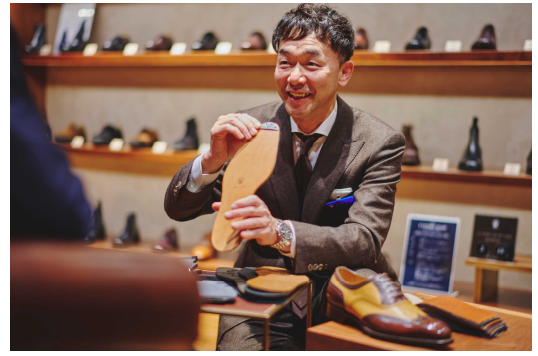
靴を熟知したスタッフがより最適な 1 足となるようご提案いたします

「三陽山長」が通年展開する『パターンメイド』企画は、約 50 からモデルを選定し、アッパー・ソール・ライニング・コバの色や素材等を複数の中からお選びいただけます。サイズ(足長) だけでなくウィズ (足囲) も最大 3 種類前えており、さらに “甲乗せ”、“幅張り” といった木型補正を加えることで甲の高さや足の幅も微調整できるため、既製品ではサイズが合いにくいお客さまもジャストフィットするお好みの一足をつくることのできる企画です。オーダーの際には、靴を熟知したスタッフがサイズ調整をはじめ素材や仕様などの選択において、より最適な 1 足となるようご提案いたします。