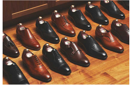
選べるモデルは約 50 種類

約 50 種に及ぶモデルからカスタマイズ可能 ウィズ、木型補正によるフィッティングの追求 アッパーやソールなど素材や色のバリエーションが充実 ディテールのカスタマイズ (メダリオン、コバ仕上げなど) も可能