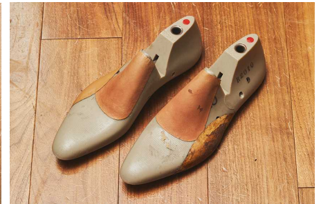
木型補正でさらにジャストフィット

理想の履き心地を実現するために入念な採寸を行います。サイズは足長だけでなく既製品では選べないウィズ (足囲) も最大 3 種類から選択可能。足長・ウィズ選びだけでは解決しきれない問題がある場合には、木型に革を張り甲を高くする“甲乗せ”と、幅を部分的に広げる“幅張り”という補正をすることで調整します。木型補正は一般的なパターンオーダーでは対応していない場合が多く「三陽山長」ならではのアドバンテージです。