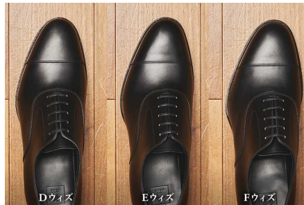
ウィズも選択可能