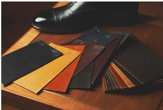
アッパーには上質なレザーを豊富に用意