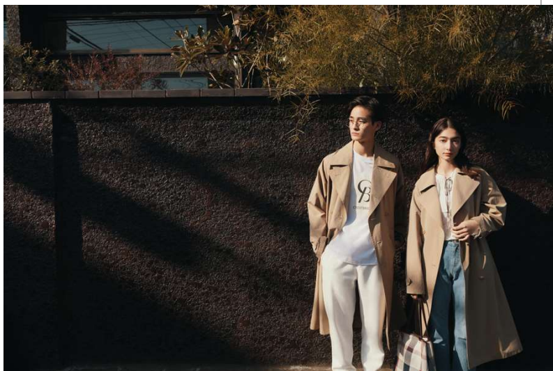
「CB CRESTBRIDGE」2022年春夏プレコレクション イメージビジュアル

株式会社三陽商会（本社：東京都新宿区、代表取締役社長：大江伸治）は、ブリティッシュ・インスピレーションをキーワードに、本当の良さがわかる洗練された人たちのためのコンテンポラリーなブランド、「BLUE LABEL CRESTBRIDGE（ブルーレーベル・クレストブリッジ）」「BLACK LABEL CRESTBRIDGE（ブラックレーベル・クレストブリッジ）」から、 新ライン「CB CRESTBRIDGE（シービー・クレストブリッジ）」を2022年秋冬シーズンにスタートいたします。