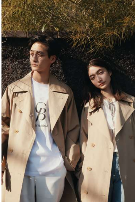
「CB CRESTBRIDGE」2022年春夏コレクション

<雑貨> バッグ： ¥4,400～¥19,800、 その他： ¥1,320～¥20,900