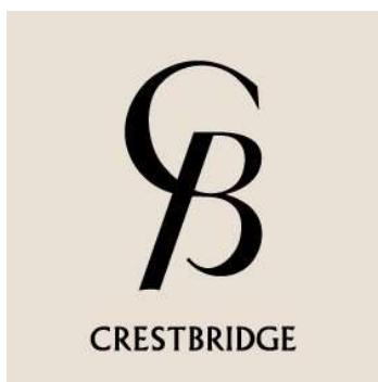
「CB CRESTBRIDGE」 □□

デビューに先駆けて3/15にSNSを開設、オンラインストアとリアル店舗にて4月下旬より先行販売を開始