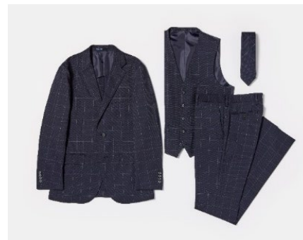
ベスト、トラウザーズ、ネクタイも展開。 4点セットでの着用が可能。

ジャケットのほか、ベスト、トラウザーズ、ネクタイも展開。4点セットでの着用はもちろん、お手持ちの無地のアイテムとあわせることで様々なビジネスカジュアルスタイルにコーディネートすることが可能です。