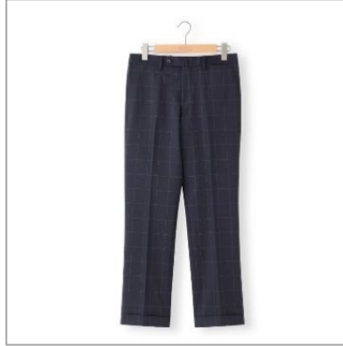
「トロッタートラウザーズ #000P」 税込価格 ¥22,000