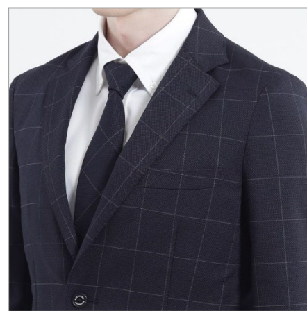
「トロッタージャケット #000P（ナンバーゼロウインドウペーン）」

「トロッタージャケット #000（ナンバーゼロ）」同様、バースアイと呼ばれる表面に凹凸のある素材を使用。先染め糸による絶妙な光沢感により品のある素材です。従来の「トロッタージャケット #000」では内側のパイピングカラーが白のところ、ウインドウペーン柄ではネイビーにすることで、全体的にシックな印象に仕上げました。