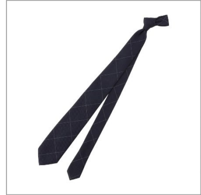
「トロッターネクタイ #000P」 税込価格 ¥11,000