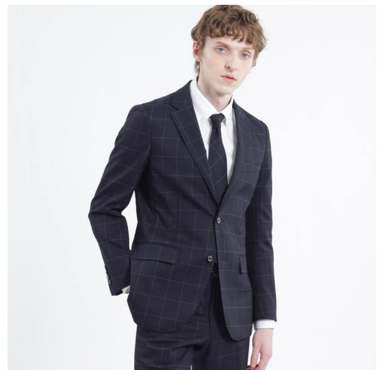
「トロッタージャケット #000P （ナンバーゼロウィンドウペーン）」

働き方の多様化を背景にビジネスカジュアルのバリエーションが広がったことから、お客さまより「柄物が欲しい」「無地のアイテムとコーディネートしたい」といったご要望をいただき、 高い機能性とデザイン性をもつ「トロッタージャケット #000」に英国の伝統的なチェックであるウィンドウペーン柄を採用した新モデル「トロッタージャケット #000P（ナンバーゼロウィンドウペーン）」 を発売することとしました。