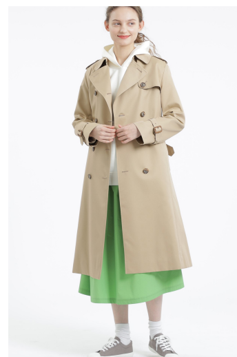
「マッキントッシュ フィロソフィー」ウィメンズ ライナーの着脱により長い期間着用できる 「花粉プロテクトコート」

2022年の「花粉プロテクトコート」は、花粉を落ちやすくする機能に加え、11型全型にはっ水性を持たせています。2月の花粉飛散時期から6月の梅雨時期まで長く着用できる軽い着心地のコートを取り揃えています。 着脱可能なライナーを付けることで寒い時期から着用できるコート、ビジネススタイルに合わせやすいトレンチコートやバルマカーンコートなど、セレモニーや通勤にも対応できるデザインを始め、襟やフードを着脱することで着回しができるコートやスポーティなブルゾンタイプなど、着用する時期とシーンに合わせてファッションとして楽しめるおしゃれなコートをラインアップしました。室内への花粉の侵入を押さえ、つらい季節を少しでも快適に過ごしていただき、「装う楽しさ」を提案いたします。