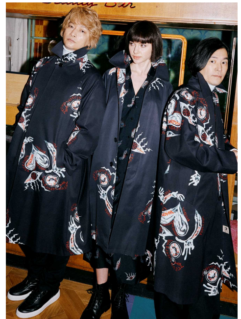
香取慎吾さんが描いたアート“MEKKEMON”が プリントされたバルマカーンコート

「SANYOCOAT」公式WEBサイト http://www.sanyocoat.jp/