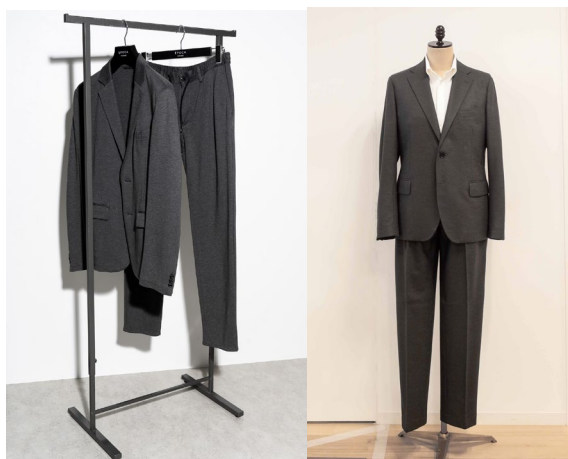
【右】 マッキントッシュ ロンドン