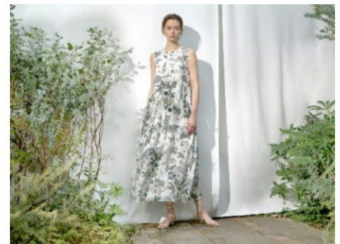
2021 年春夏「S.ESENTIALS」ビジュアル